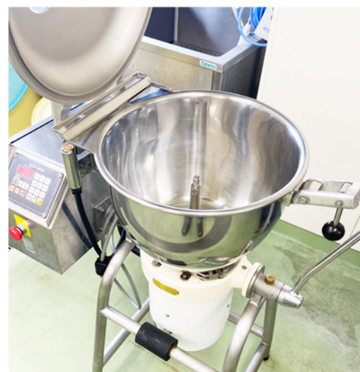
カッターミキサー