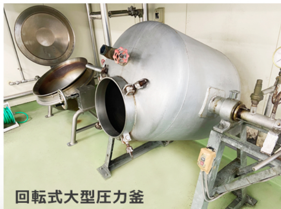
回転式大型圧力釜